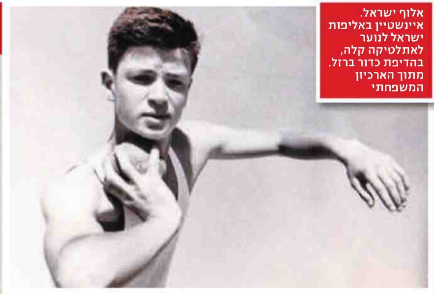
אלוף ישראל. איינשטיין באליפות ישראל לנוער לאתלטיקה קלה, בהדיפת כדור ברזל. מתוך הארכיון המשפחתי